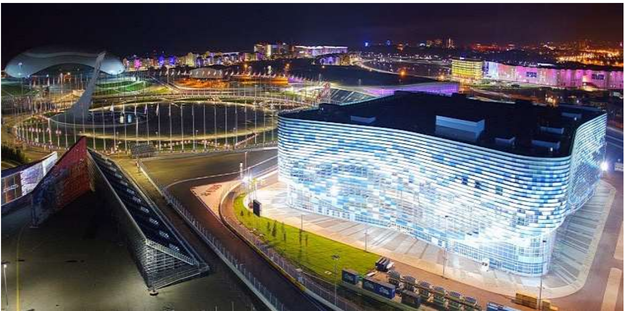
Океанариум – 25 минут от отеля