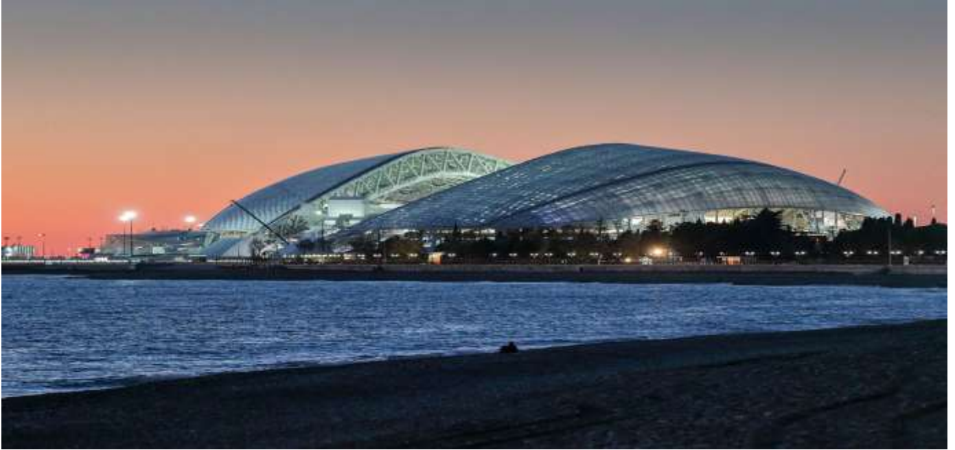
Arena «Iceberg» - 10 минут от отеля